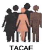
Table d'action contre l'appauvrissement de l'Estrie (TACAE)