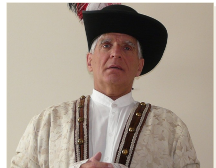
M. Paul-Chomedy de Maisonneuve par M. Louis Lavoie

Le diner est offert gracieusement par l'AREQ aux personnes nouvellement retraitées et aux membres à qui le secteur rendra hommage, ceux nés en 1942 . À ces personnes, un dépôt de 10$ vous est demandé pour assurer votre couvert auprès du traiteur; votre chèque vous sera remboursé sur place. 🍷 🍷 🍷